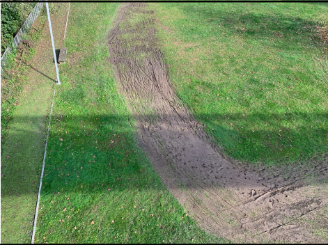
Parque Corgo a 25 DE NOVENBRO DE 2018