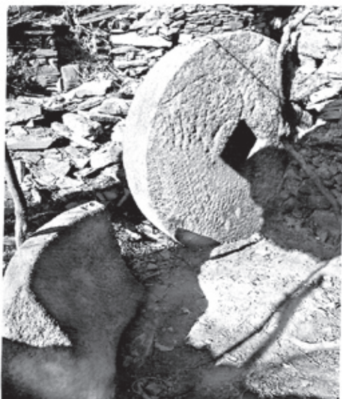
Atafona de Avarenta, parcialmente destruída

Atafonas são os moinhos onde se processava a redução da folhagem do sumagre a pó para posterior comercialização. Sabemos de algumas poucas atafonas que, embora em semi-ruína, ainda existem na nossa região transmontano-duriense, uma em Avarenta, no concelho de Valpaços, outra em Vale de Figueira, no concelho de S. João da Pesqueira – esta muito curiosa por ter a base em xisto – e ainda uma terceira em Muxagata, no concelho de Vila Nova de Foz Côa, que é a que está melhor conservada, apesar de instalada num casinhoto de xisto transformado em loja de gado