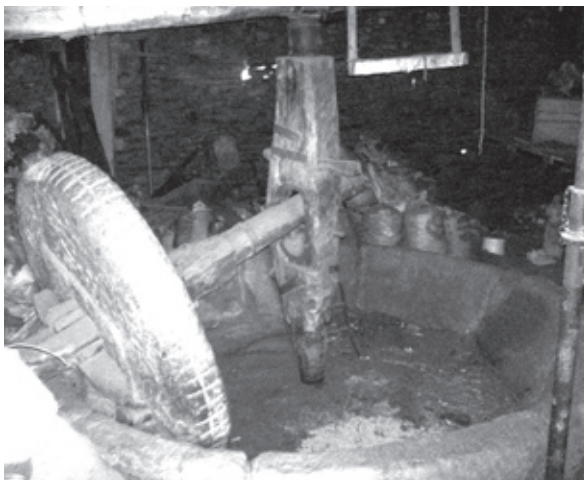
Atafona da Muxagata

onde coabitam dois cães, uma mula e meia dúzia de pombas... Há registos da existência nos anos vinte do século passado de cinco atafonas ainda a funcionar no concelho de Foz Côa, uma na freguesia de Mós e de quatro na própria vila. A referida freguesia de Mós era, à semelhança de Avarenta, de Tinalhas e de outras terras do nosso país, conhecida como terra de sumagreiros e uma crónica