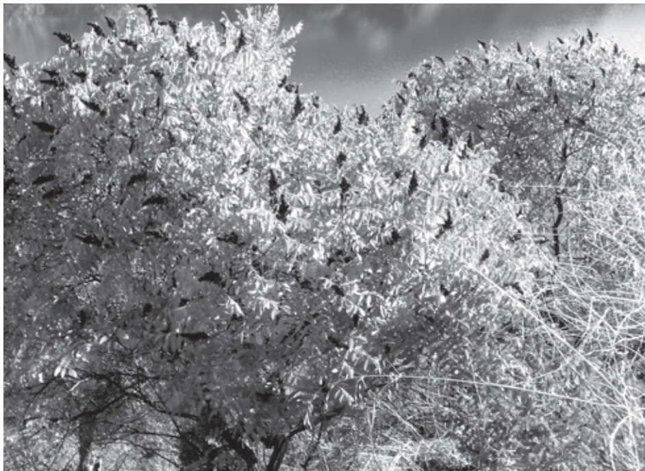
Sumagre num talude junto ao rio Douro na Ferradosa

Foi na transição do século XVII para o XVIII que a produção e comércio do sumagre atingiram o auge na região de Riba-Douro. Com o desenvolvimento da viticultura, sobretudo a partir da demarcação pombalina, este cultivo fora progressivamente substituído pela vinha, entrando em declínio, declínio esse apenas interrompido nas últimas décadas do século XIX e primeiras do século XX, devido à grande crise provocada pela filoxera, em que o sumagre, juntamente com o cânhamo e o tabaco foram as culturas alternativas à vinha.