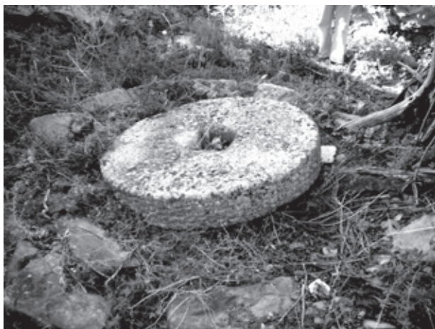
Atafona de Vale de Figueira